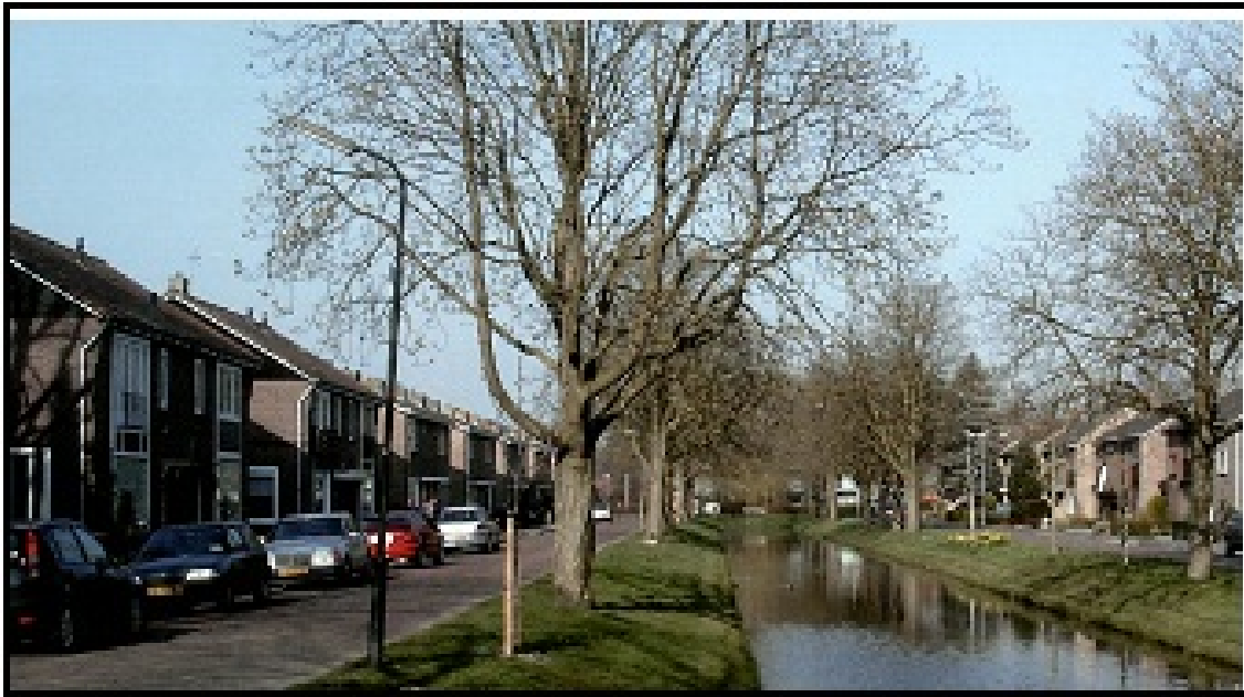
Figuur 3.2 Impressie buurten (Prinses Wilhelminasingel)