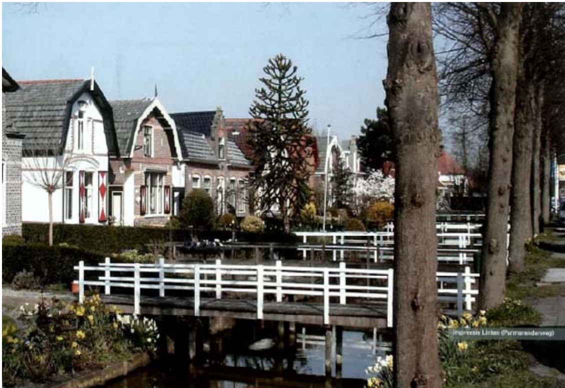
Figuur 3.1 Impressie lintbebouwing (Purmerenderweg)